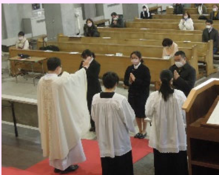
1月2日 成人のお祝い